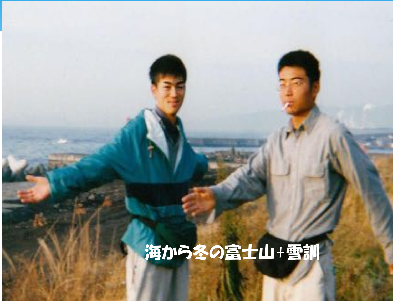
海から冬の富士山+雪訓